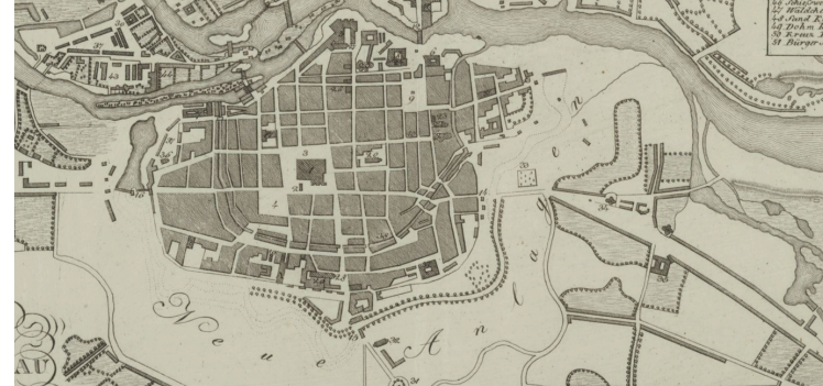
Siedemset metrów historii